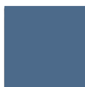
Bleu turquoise RAL 5018