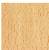
Hêtre naturel vernissé 350