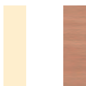
Hêtre - chants Hêtre RHE

Type L Stratifié ép. 23.6 mm - Chants PVC