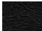
Noir texturé RAL 9005 NT