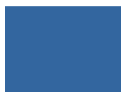
Bleu outremer RAL 5002 BO