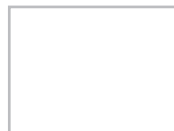
Blanc RAL 9010 BL