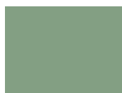
Vert pastel RAL 6021 VP