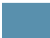
Bleu pastel RAL 5024 PB