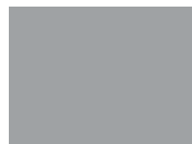
Gris 7037 GS