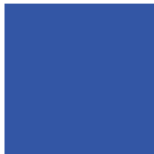
Bleu ciel RAL 5015