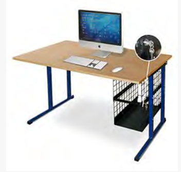
Postes info. Rousseau