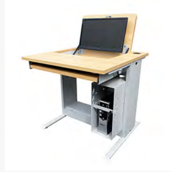
Postes info. Hugo