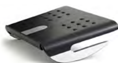
Bois noir (K)