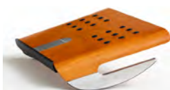
Bois cerisier (C)