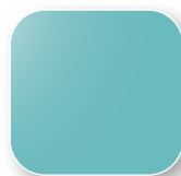
Vert d'eau RAL 6027 Code VA