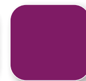
Violet RAL 4008 Code R3