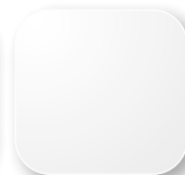
Blanc proche RAL 9003 Code A7 (surcoût +3%)