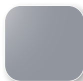
Gris proche RAL 7004 Code GG