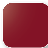
Rouge RAL 3003 Code R2