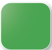
Vert RAL 6018 Code V1