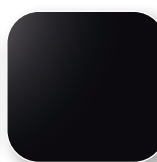
Noir Code NO