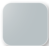
Gris Clair RAL 7035 Code G2