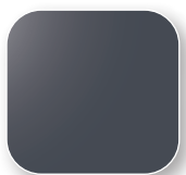
Anthracite proche RAL 7024 Code GE