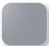
Gris proche RAL 7004 Code GG