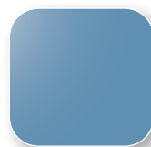
Bleu clair RAL 5014 Code BB