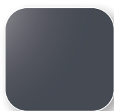
Anthracite proche RAL 7024 Code GE