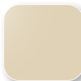
Beige RAL 1015 Code C6