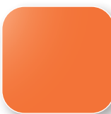
Orange RAL 2008 Code RC