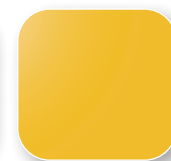
Jaune RAL 1023 Code J5