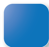
Bleu RAL 5015 Code B6