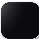
Noir Code NO